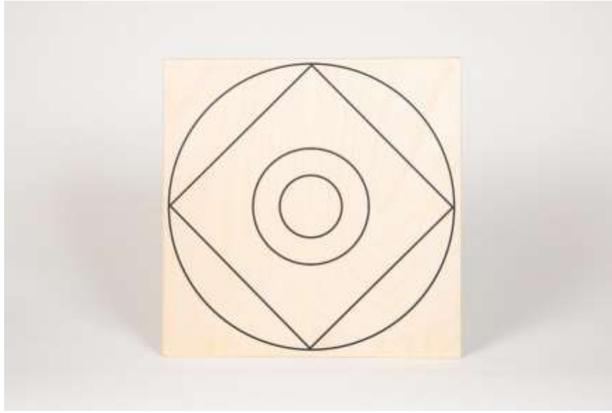
Symbol Christusbewusstsein 9 Druck auf Holz