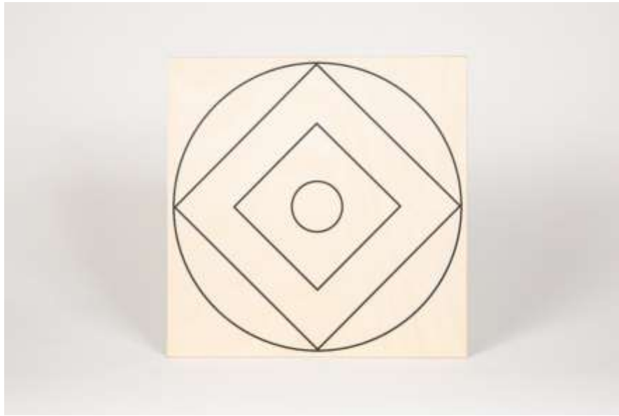
Symbol Christusbewusstsein 13 Druck auf Holz