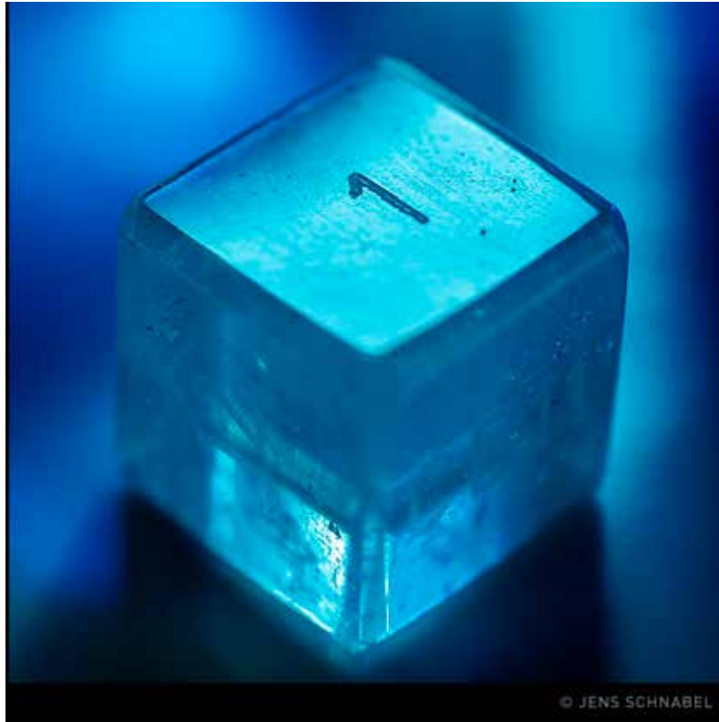
Kristallwürfel des Aufstiegs