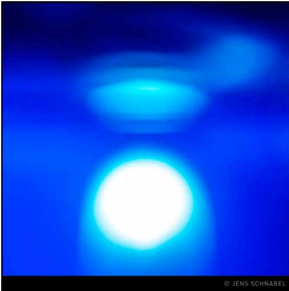
Flammen des Aufstiegs